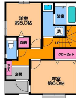
【C号棟：4,290万円(税込)】 土地面積：75.67㎡(22.89坪) 建物面積：92.94㎡(28.11坪)