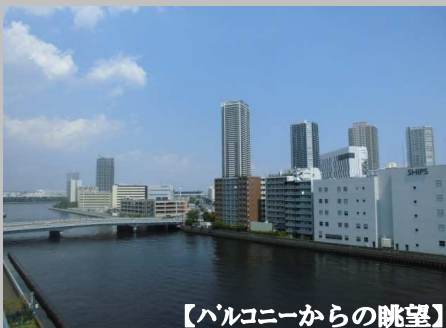
【バルコニーからの眺望】